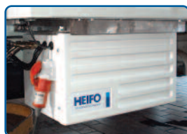
stand-by-kit voor een elektrische aandrijving