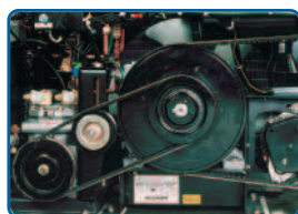
Alle voor het onderhoud belangrijke onderdelen zijn makkelijk bereikbaar