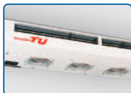
Opties: platte verdamper (128 mm hoog)