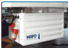
stand-by-kit voor een elektrische aandrijving