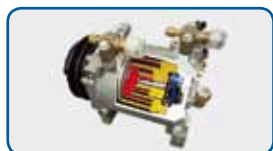
3D Scroll compressor