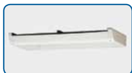
200 mm platte verdamper